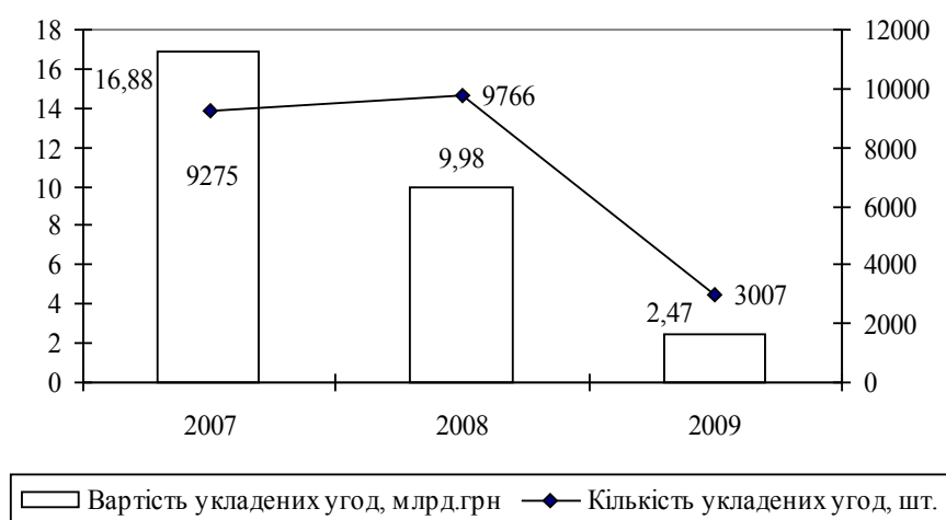
Рис. 1. Кількість і вартість укладених договорів фінансового лізингу у 2007-2009 рр.*

Негативні зміни у позитивну динаміку розвитку вітчизняного лізингового ринку внесло розгортання світової фінансово-економічної кризи (рис. 1).