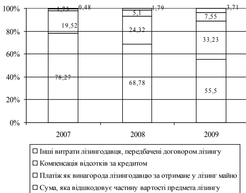
Рис. 2. Структура лізингових платежів у 2007-2009 рр.,%*

Протягом останніх трьох років значної якісної зміни зазнала і структура лізингового платежу (рис. 2).