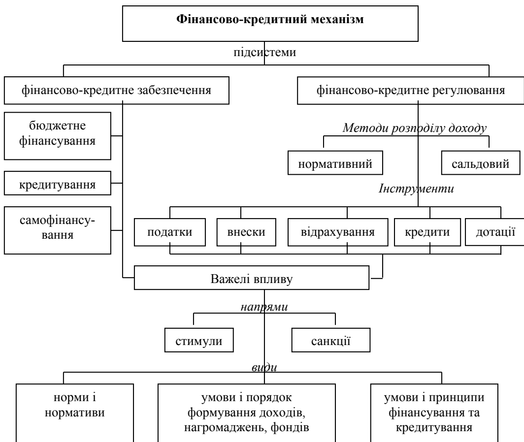
Рис. 2. Структура фінансово-кредитного механізму [4, С.61]

За методом впливу на соціально-економічний розвиток у фінансово-кредитному механізмі виділяють дві підсистеми: фінансово-кредитне забезпечення та фінансово-кредитне регулювання (рис.2).