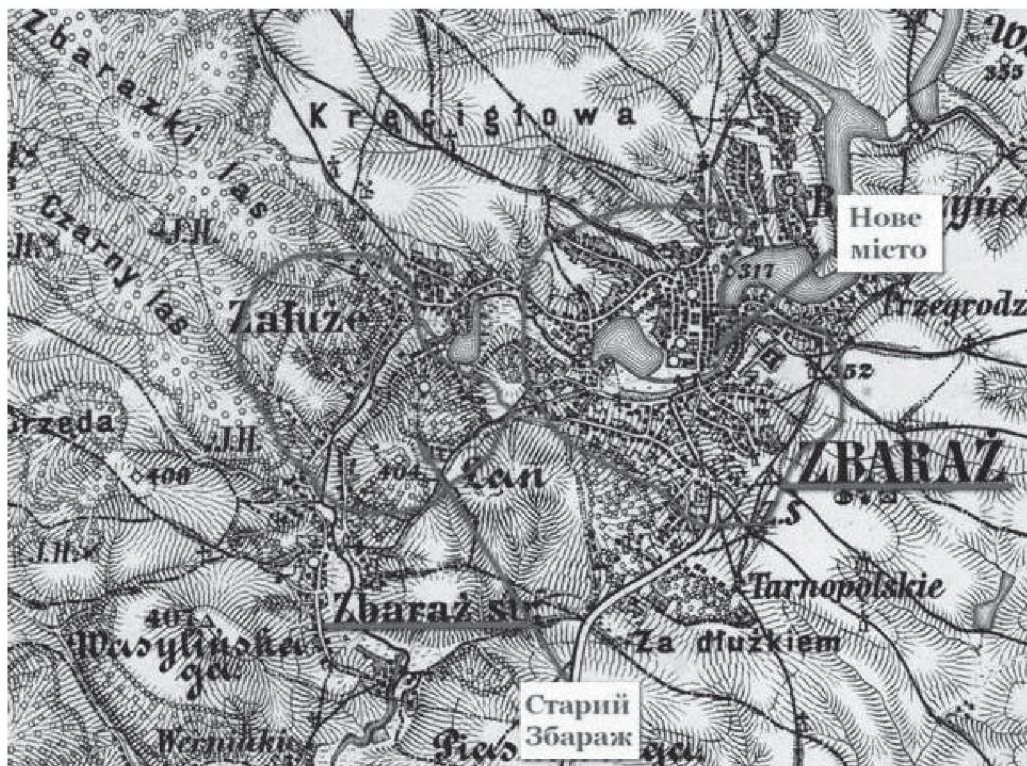
Карта 3. Старий Збараж та Нове місто на австрійській топокарті 1880 р.