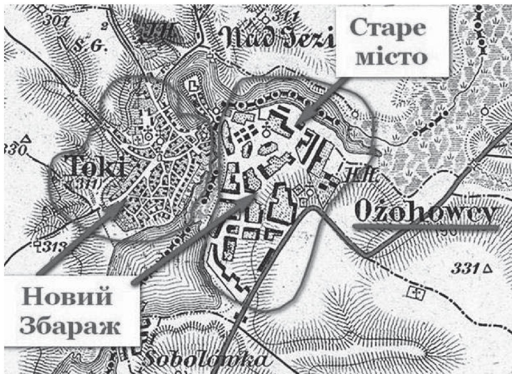
Карта 4. Ожигівці-Новий Збараж на австрійській топокарті 1880 р.