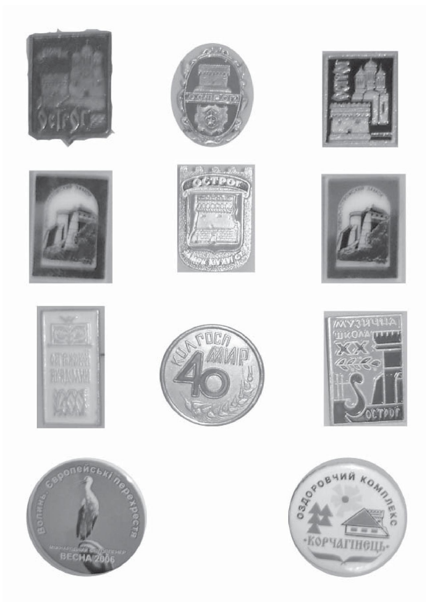
Значки острозької тематики з колекції Державного історико-культурного заповідника м. Острога