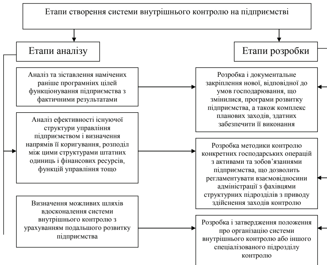
Рис. 2. Процес створення системи внутрішнього контролю на підприємстві*

* Узагальнено автором на основі джерел: [1; 3]