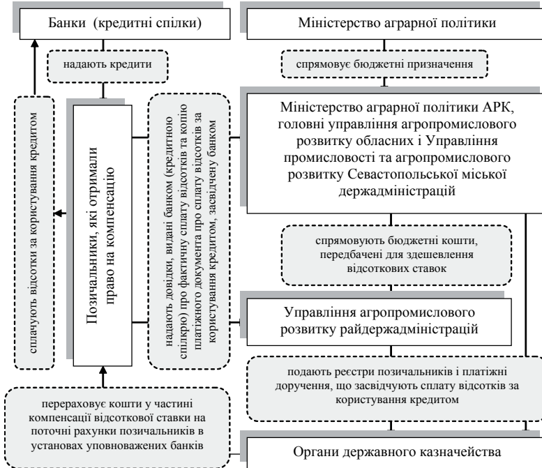
Рис. 3. Схема використання бюджетних коштів, спрямованих на здешевлення відсоткових ставок за кредитами, наданими підприємствам АПК

продлонгації кредитів потребують 2057 аграрних підприємств на суму 3,8 млрд. грн. За січень-лютий 2009 р. комерційні банки продлонгували кредити приблизно тисячі суб'єктам аграрного ринку на суму близько 2 млрд. грн. За два місяці поточного року лише 250 підприємств АПК отримали нові кредити на суму, що не перевищує 500 млн. грн. [5].