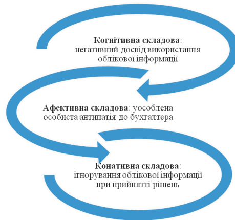
Рис. 2. Приклад компонентного взаємозв'язку у структурі індивідуального стереотипу, сформованого щодо облікової інформації