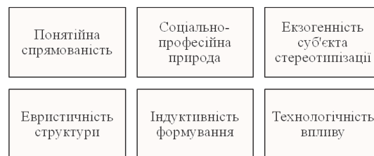
Рис. 1. Типологічні характеристики стереотипів щодо облікової інформації

Вищевказане дозволяє нам виокремити низку ознак, характерних для стереотипів, що стосуються облікової інформації (рис. 1).