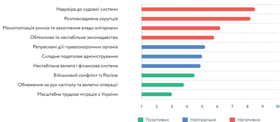
Рис. 3. Основні перешкоди для іноземних інвестицій в Україну в 2020 р.