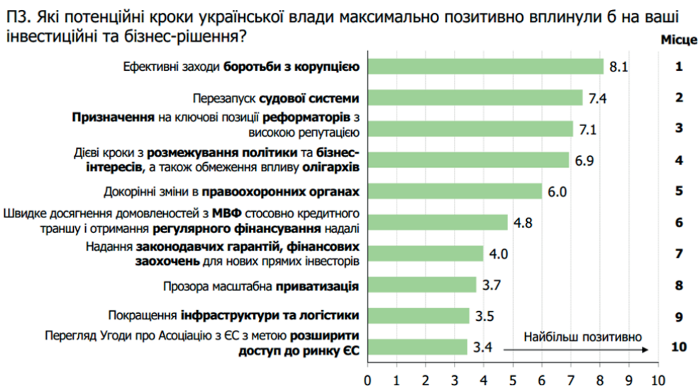
Рис. 4. Потенційні заходи, які можуть покращити інвестиційну привабливість України в 2020 р.

В цьому дослідженні опитувані інвестори розповіли про речі, які максимально позитивно вплинули б на інвестиційну привабливість (рис. 4) [8].