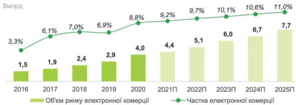
Рис. 1. Динаміка ринку електронної комерції та її частки у роздрібній торгівлі