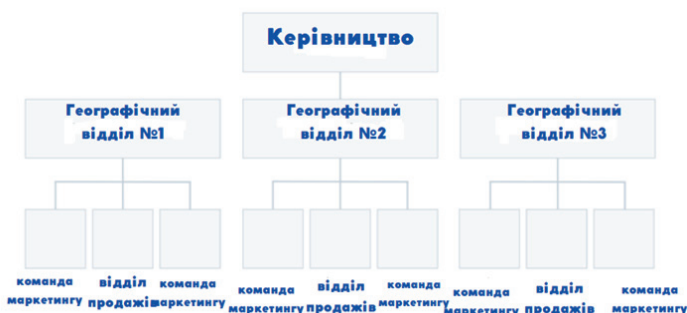
Рис. 3. Ринкова структура [Devaney Erik, 2022].

Ще одним різновидом організаційної структури є ринкова структура (див. рис. 3), в якій підрозділи організації базуються на напрямках діяльності або типах клієнтів.