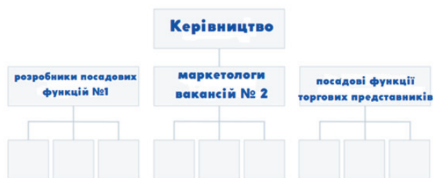
Рис. 1. Функційна організаційна структура [Devaney Erik, 2022].

Варто відзначити функційну організаційну структуру (див. рис. 1), одну з найпоширеніших серед видів структур, що застосовують у діяльності організацій. Основною перевагою є поділ організації на відділи на основі спільних робочих функцій та завдань. Підприємство, яке у своїй діяльності використовує функційну організаційну структуру, об'єднує всіх маркетологів в одному відділі, економістів в іншому відділі тощо [Devaney Erik, 2022].