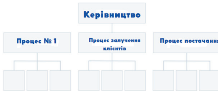
Рис. 5. Процесно орієнтована структура [Devaney Erik, 2022].

Організаційну структуру на основі процесів (рис. 5) розробляють навколо наскрізного потоку різних видів діяльності, таких як «дослідження та розробка», «залучення клієнтів» та «виконання замовлень». На відміну від суто функційної структури, процесно орієнтована структура враховує не тільки діяльність, яку виконують співробітники, але й те, як ці різні види діяльності взаємодіють одна з одною.