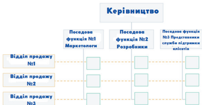
Рис. 6. Матрична структура [Devaney Erik, 2022].

На відміну від інших структур, матрична організаційна структура (див. рис. 6) не відповідає традиційній ієрархічній моделі. Натомість усі працівники мають подвійні відносини підзвітності перед керівництвом. Як правило, існує функційна лінія звітності (зображена синім кольором), а також лінія звітності на основі виконаних завдань (зображена червоним кольором).