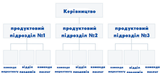
Рис. 2. Структура підрозділу на основі виду діяльності [Devaney Erik, 2022].

Надзвичайно важливою є структура підрозділу на основі виду діяльності (див. рис. 2), яка складається з кількох функційних структур, тобто кожен підрозділ у структурі може мати власну команду маркетингу, власну команду продажів тощо.