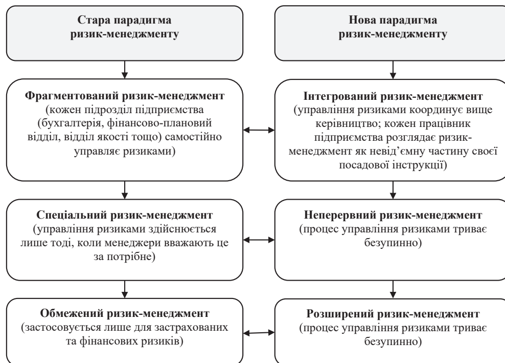
Рис. 1. Ознаки старої та нової парадигм ризик-менеджменту підприємств територіальних громад України

Зазвичай ризик-менеджмент підприємств України зводиться до страхування, хеджування ризиків, не є комплексною системою та фрагментарно реалізується у розрізі окремих відділів/підрозділів. Розглянемо детальніше ознаки старої та нової парадигм ризик-менеджменту підприємств територіальних громад України (рис. 1), що вкотре підтверджує перевагу інтегрованого, неперервного та розширеного ризик-менеджменту.