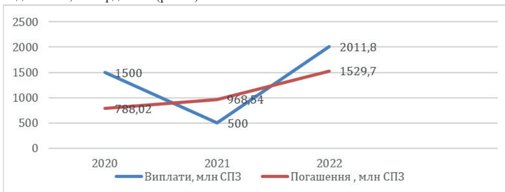
Рис. 2. Динаміка проведених кредитних операцій України з МВФ у 2020-2022 рр.

Аналіз співпраці уряду України з МФІ також підтверджує, що кредитні кошти від МФІ є основним джерелом довгострокового фінансування соціально-економічних проєктів розвитку України у пріоритетних галузях її діяльності. На сьогодні основні інвестиційні проєкти реалізуються в різних сферах економіки та державного управління, зокрема: у сфері енергетики, у сфері охорони здоров'я, у сфері освіти, у сфері житлово-комунальної інфраструктури, у сфері дорожнього будівництва. Також, залучені фінансові ресурси від МФІ забезпечують фінансування різних стратегічних реформ щодо прискореного економічного росту країни, покращення діяльності її фінансового та кредитного секторів. Починаючи з 1992 року, найбільшим кредитором з-поміж МФІ для України є МВФ. Співпраця України із цією МФІ розпочалась з 1992 року, коли відповідно Закону України «Про вступ України до Міжнародного валютного фонду, Міжнародного банку реконструкцій та розвитку, Міжнародної фінансової корпорації, Міжнародної асоціації розвитку та Багатостороннього агентства по гарантіях інвестицій» наша країна набула членства у всіх цих МФІ [9]. Співпраця з МВФ забезпечує стабілізацію української фінансової системи, впровадження програм структурних реформ та умов щодо сталого економічного зростання. За останні три роки Україна отримала від МВФ 4,01 млрд. СПЗ (рис. 2).