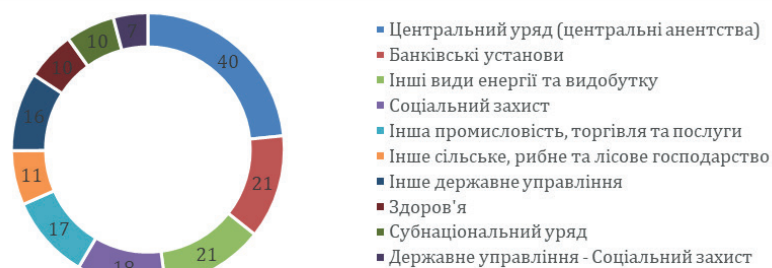
Рис. 3. Основні напрями реалізації проектів Світового Банку в Україні за секторами у 2023 році

Світовий банк на відміну від МВФ кредитні ресурси спрямовує не на макроекономічну стабілізацію, а на реалізацію інвестиційних проектів у різних секторах економіки України. Станом на 2023 рік найбільша кількість цих проектів в Україні стосується діяльності центрального уряду (центрального агентства) – 40 проектів, що становлять 23% від їх загальної кількості, 21 проект здійснений у сфері діяльності банківських установ та відповідно стільки ж спрямовані на сектор енергії та видобутку, також 18 проектів впроваджені у сфері соціального захисту, що на сьогодні є надзвичайно важливим аспектом в наявному стані функціонування економіки держави (рис. 3).