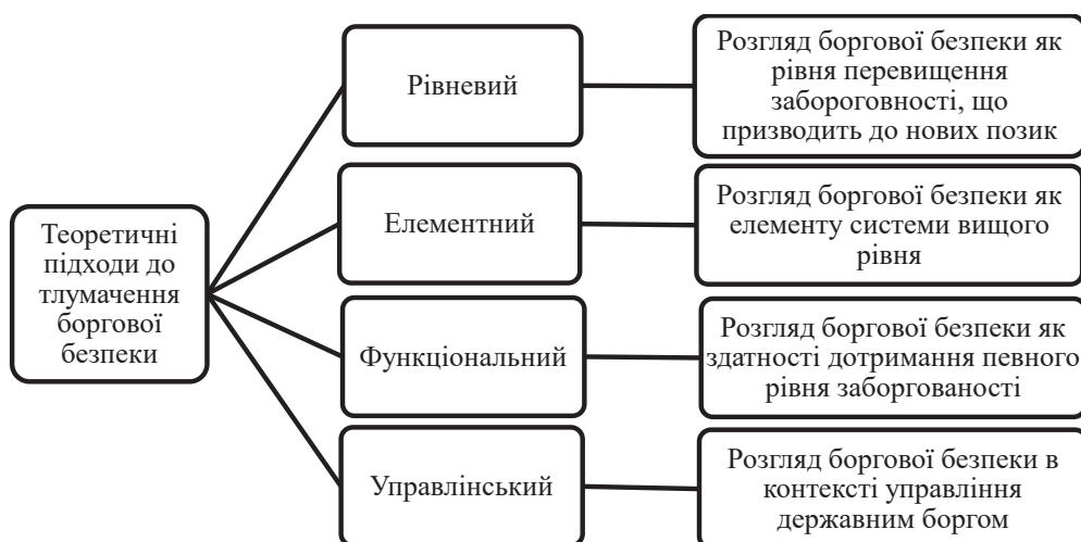
Рис. 1. Підходи до тлумачення поняття «боргова безпека»

Для зменшення обсягів та негативних наслідків боргового навантаження Україна повинна впроваджувати раціональну боргову політику. Це включає в себе оптимізацію структури державних запозичень, зменшення дефіциту державного бюджету, покращення управління державним боргом та нарощування боргової безпеки. При розкритті сутності поняття «боргова безпека» нами було виокремлено такі підходи (рис. 1):