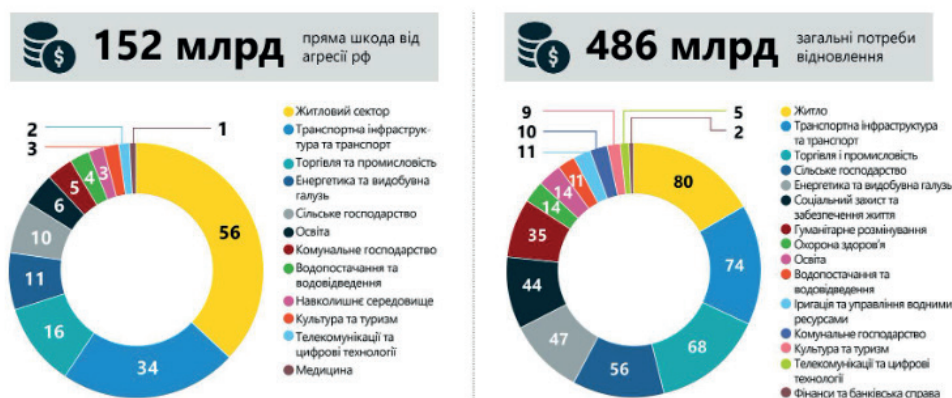
Рис. 3. Звіт про потреби відновлення України станом на 1 січня 2024 р., млрд дол. США

Згідно з рис. 3, найбільшої шкоди зазнали такі галузі, як житловий сектор, транспортна інфраструктура, промисловість, енергетика та сільське господарство. Ці 5 сфер економіки отримали 75 % загальної прямої шкоди від агресії росії. Ті ж самі галузі потребують найбільшої допомоги.