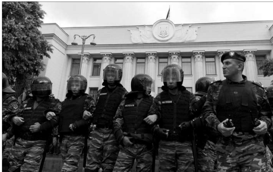
Верховна Рада України, Київ, 7 липня 2011 року

Твердження про гібридний тип режиму вимагає уточнень. Отже, якщо у період президентства Ющенка цей гібридний режим мав більше демократичних, ніж авторитарних ознак (віль-