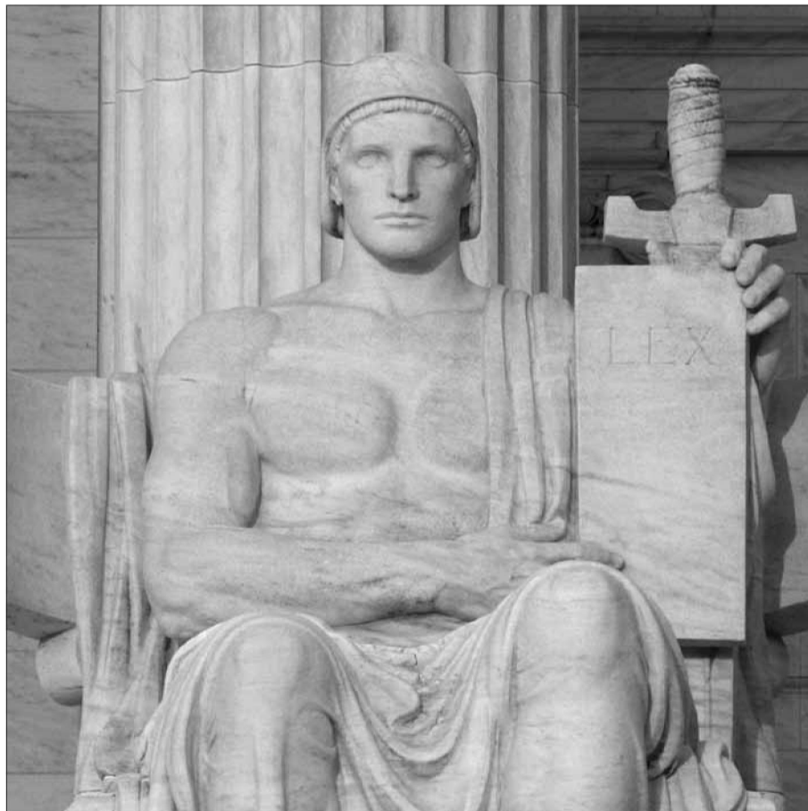
Влада закону. Статуя роботи Джеймса Ерла Фрейзера біля сходів будівлі Верховного Суду США у Вашингтоні (1935)

не компенсуючи це відповідним обсягом відповідальності. Несформованість практик притягнення до відповідальності політично уповноважених інститутів робить дуалістичну модель відносин «держава-суспільство» асиметричною, імперативною для суспільства і диспозитивною для держа-