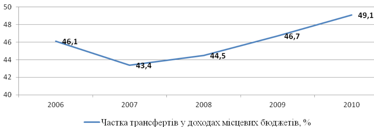
Рис. 1. Частка міжбюджетних трансфертів у структурі доходів місцевих бюджетів протягом 2006 – 2010 рр., %.

На жаль, в Україні, попри всі намагання, так і не створено самостійних місцевих бюджетів, які б сприяли активному соціальному та економічному розвитку регіонів країни. Фіскальні можливості місцевих бюджетів є недостатніми, що породжує об'єктивну потребу в ефективній системі міжбюджетних трансфертів. За своїм призначенням, ця система покликана виконувати перерозподільчу функцію аби збалансувати бюджети різних рівнів. Проте, в Україні, починаючи з 2007 року, частка трансфертів у доходах місцевих бюджетів постійно зростає і в 2010 році практично становить 50 % від всього обсягу, що відображено на рисунку 1. Ця тенденція ще раз доводить про те, що місцеві бюджети України суттєво залежать від різних видів дотацій.