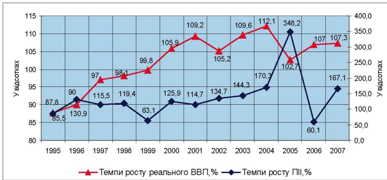
Рис. 1. Динаміка темпів росту реального ВВП України та ПІІ в державу впродовж 1995 – 2007 років, млн. грн

хоча і вплив ПІІ на ВВП починає зростати в силу збільшення їх частки у головному макроекономічному показнику держави.