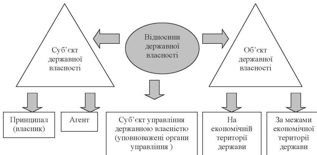
Рис. 2. Система відносин державної власності*