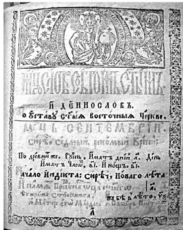
“Місяцеслов” з “Часослова полууставного” Львів 1642 р.

Я. Запаско та Я. Ісаевич подають дане видання як надзвичайну бібліографічну рідкість. В бібліотеках і збірках це видання відсутнє. В каталог книга включена із згадки в АЮЗР (Архив ЮгоЗападной России, издаваемый Временной Комиссией для разбора древних актов. К., 1889-1904. Ч. 1 т. 11, с. 541.)