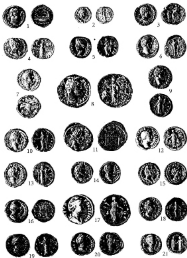
Римські монети зі скарбів Волині: 1, 3, 4 – срібні денарії Адріана; 2 – срібний квінтарій Адріана; 5, 6 – срібні денарії Емілія Вера; 7, 9, 10, 12, 13 – срібні денарії Антоніна Пія; 8 – мідний ас Антоніна Пія; 11 – срібний ауреус Антоніна Пія; 14, 15 – срібні денарії Антоніна Пія і Марка Аврелія; 16, 18–21 – срібні денарії Фаустини Старшої; 17 – мідний ас Фаустини Старшої