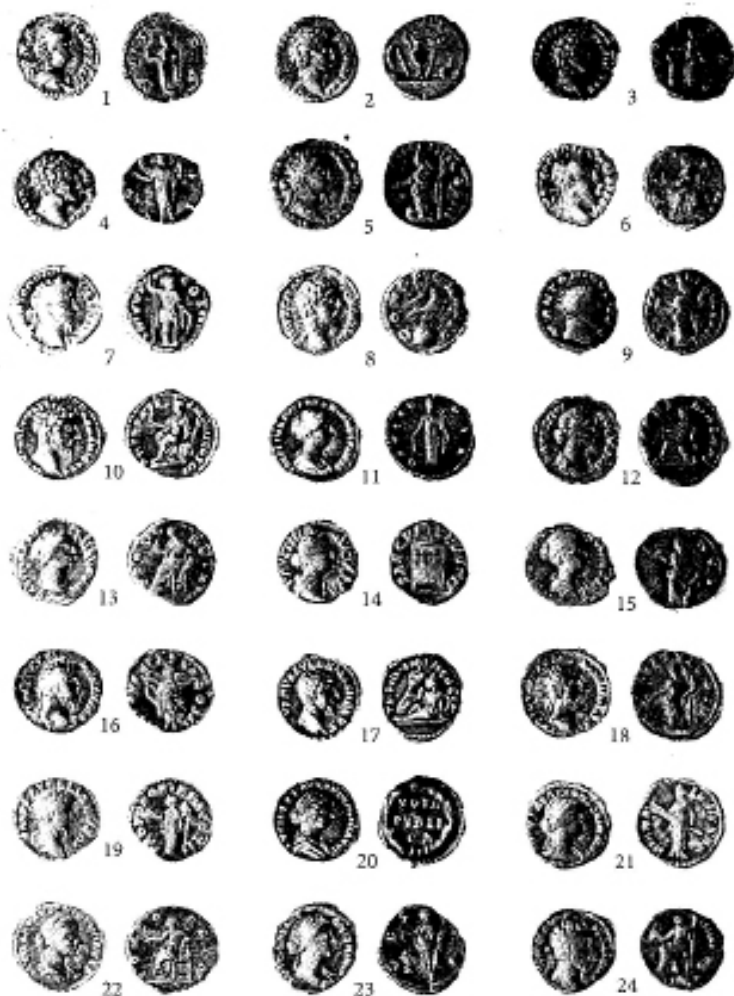
Римські монети зі скарбів Волині: 1 – срібний денарій Фаустини Старшої; 2–10 – срібні денарії Марка Аврелія; 11–15 – срібні денарії Фаустини Молодшої; 16–19 – срібні денарії Луція Вера; 20–23 – срібні денарії Луцілли; 24 – срібний денарій Коммода