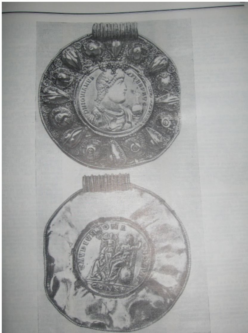
Золотий медальйон імператора Клавдія Йовіана (363-364 рр. н. е.)