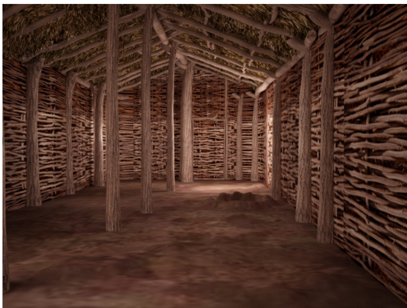
Рис. 2. Реконструкція інтер'єру житла КЛСК