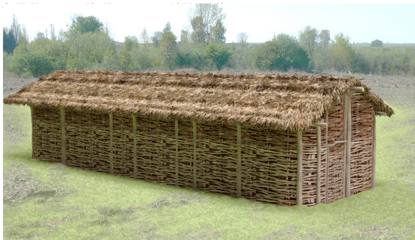
Рис. 1. Реконструкція екстер'єру житла КЛСК