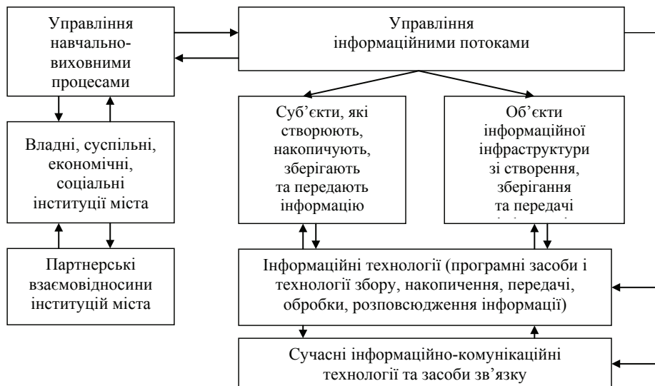
Рис. 3. Елементи інформаційно-освітньо-виховного простору міста

Розглянемо формування єдиного інформаційно-освітньо-виховного простору на основі партнерських взаємовідносин соціальних та економічних інституцій на прикладі міста Слов'янська, який є університетським центром зі значним інтелектуальним та освітньо-виховним потенціалом. Загальна кількість студентів Донбаського державного педагогічного університету денної та заочної форм навчання складає понад 8 тис. осіб. Підготовка та перепідготовка здійснюється за 60 освітніми напрямками та спеціальностями на 59 кафедрах 8 факультетів (фізико-математичний, філологічний, підготовки вчителів початкових класів, дошкільної освіти та практичної психології, дефектологічний, технологічний, фізичного виховання, психології, економіки та управління).