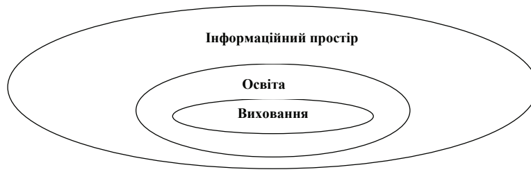
Рис. 2. Модель єдиного інформаційно-освітньо-виховного простору

Серед основних вимог до формування єдиного інформаційно-освітньо-виховного простору міста на основі партнерських взаємовідносин соціально-економічних інституцій треба визначити такі: