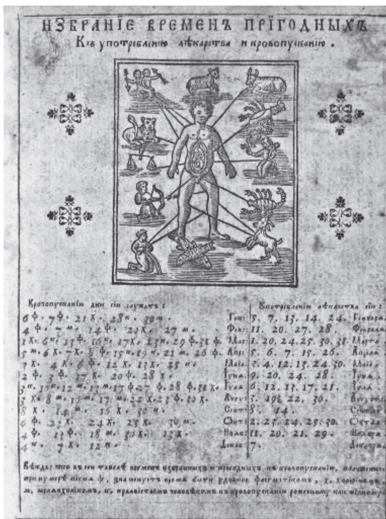
Мал. 4. «Зодіакальна людина» «Календар 1727 р.» [2, с. 654]