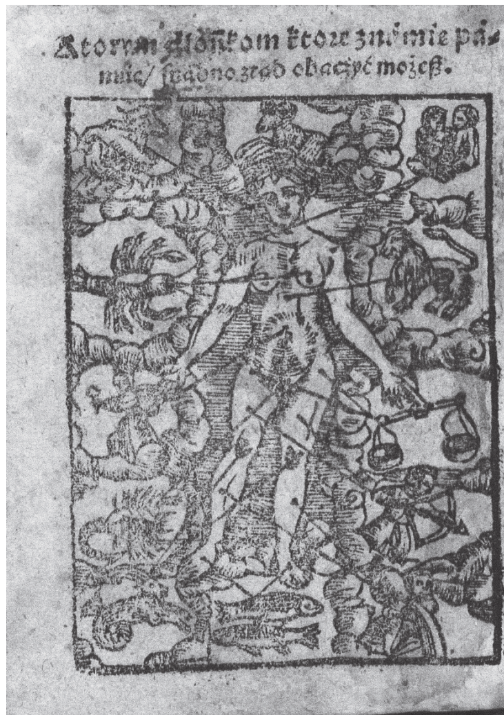
Мал. 3. «Зодіакальна людина» із тексту Яна Лятоса «Пересторога різноманітних випадків із науки зірок і небесних тіл на рік Божий 1599, який відбувся від створення світу 5561» [1, арк. 20]

Окрім цих зображень можна виділити деякі пасажі з рукописного збірника «Острология», що датується кінцем XVII ст., де також описано співвідношення знаків зодіаку і частин людського тіла [6, с. 22]. Це досить типовий текст для астрологічної тематики, який все ж має свої особливості: