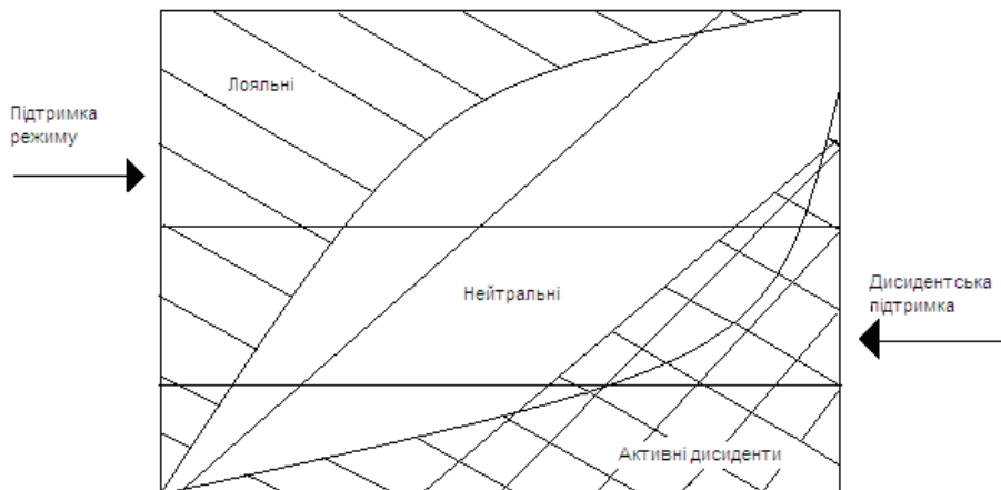
Мал.№ Гіпотетичний патерн інституціональної підтримки, що сприяє виникненню внутрішньої війни

Перехід від низького рівня незадоволення до помірного або інтенсивного відбувається у різні часи та з різним масштабом явищ хаотизації. Це залежить від багатьох факторів і, у тому числі, від економічних – безробіття, рівня цін, вартості життя тощо. Неабияку роль відіграють зовнішні сили підтримки режиму чи девіантів (за Т.Гарром – дисидентів). На певному етапі прошарок нейтральних груп розчиняється, що створює відкрите протистояння лояльних до політики уряду та тих, хто дотримується протилежних поглядів (рис.4).