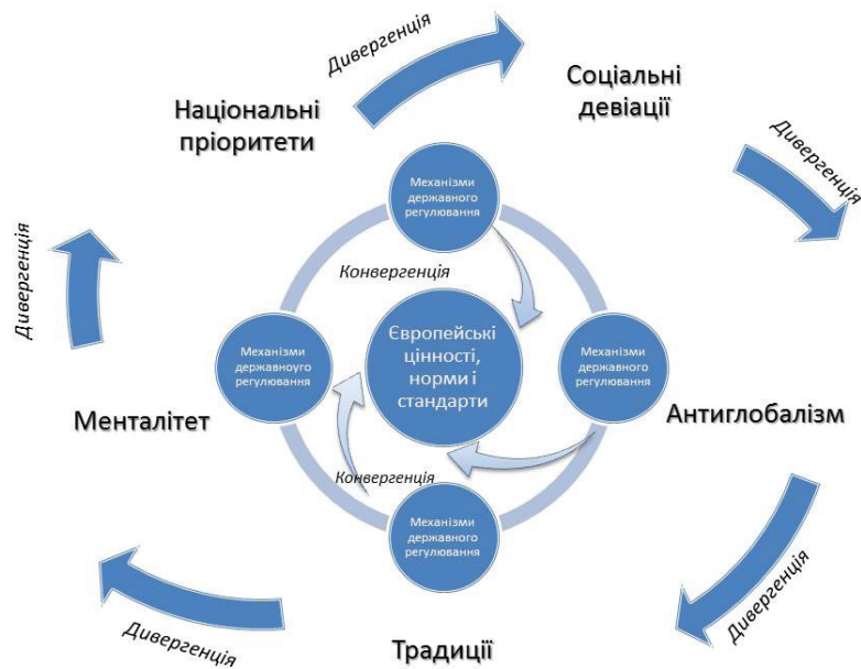
Рис. 2. Модель конвергенції-дивергенції в системі інтеграційних відносин