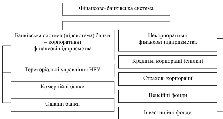
Рис. 1. Структура фінансово-банківської системи [6]

Окрім банківських установ, фінансово-банківська система включає установи, що є поза межами впливу Національного банку України (рис. 1).