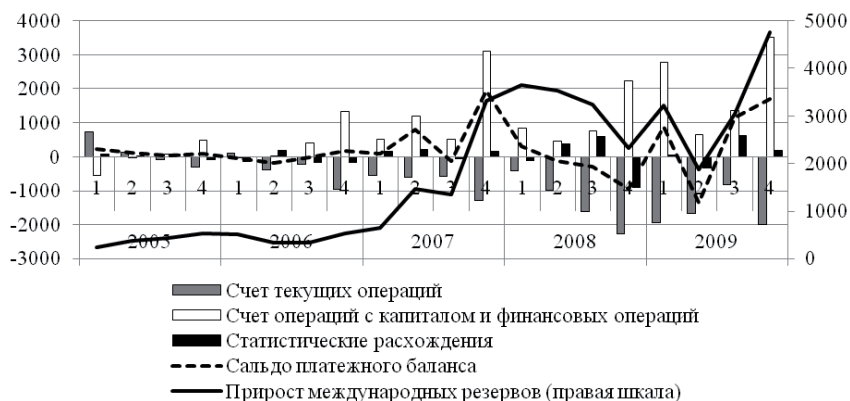
Рис. 4. Платежный баланс и международные резервы Республики Беларусь за период 2005 – 2009 гг. (млн долларов США)

На рисунке 4 отражена динамика категорий платежного баланса и прирост международных резервов Республики Беларусь за счет его финансирования в 2005 – 2009 гг. Видно, что за счет положительного сальдо платежного баланса международные резервы возросли за анализируемый период на 4756 млн долларов США. Учитывая, что на начало 2010 года международные резервы составили 5652,5 млн долларов США, можно заключить, что положительное сальдо платежного баланса является основным источником их пополнения. Необходимо отметить, что прирост резервов в основном обеспечивается за счет положительного сальдо счета операций с капиталом и финансовых операций.