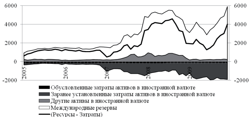
Рис. 2. Международные резервные активы и ликвидность Республики Беларусь в иностранной валюте за период 2005 – 2009 гг. (млн. долларов США)