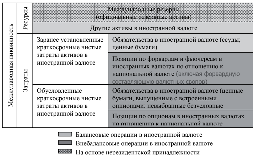
Рис. 1. Схематическое представление связи между концепциями международных резервов и ликвидности в иностранной валюте

активы выступают основой международной ликвидности, и, следовательно, от их качественных и количественных характеристик определяется уровень ликвидности в иностранной валюте государства.