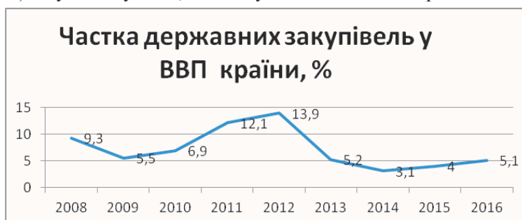
Рис. 3. Аналіз динаміки частки державних (публічних) закупівель у ВВП країни за 2008-2016 рр.

Масштабність і значущість публічних закупівель для країни характеризує такий показник як частка державних (публічних) закупівель у ВВП, динаміку якого наведено на рис. 3.