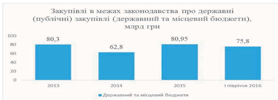
Рис. 2. Аналіз динаміки публічних закупівель коштом державного та місцевого бюджетів за 2013-2016 рр.