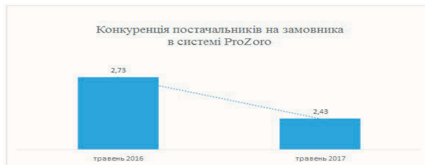
Рис. 4. Динаміка рівня конкуренції в системі «Прозоро» за травень 2016 та 2017 рр.

У країні останнім часом спостерігають негативну тенденцію до зменшення рівня конкуренції під час проведення публічних закупівель (рис. 4). Так, якщо в травні 2016 р. рівень конкуренції загалом у системі «Прозоро» складав 2,73 пропозицій на 1 учасника, то в травні 2017 р. він знизився до 2,43, тобто на 0,3.