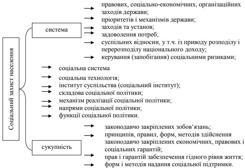
Рис. 2. Систематизація підходів до з'ясування сутності соціального захисту