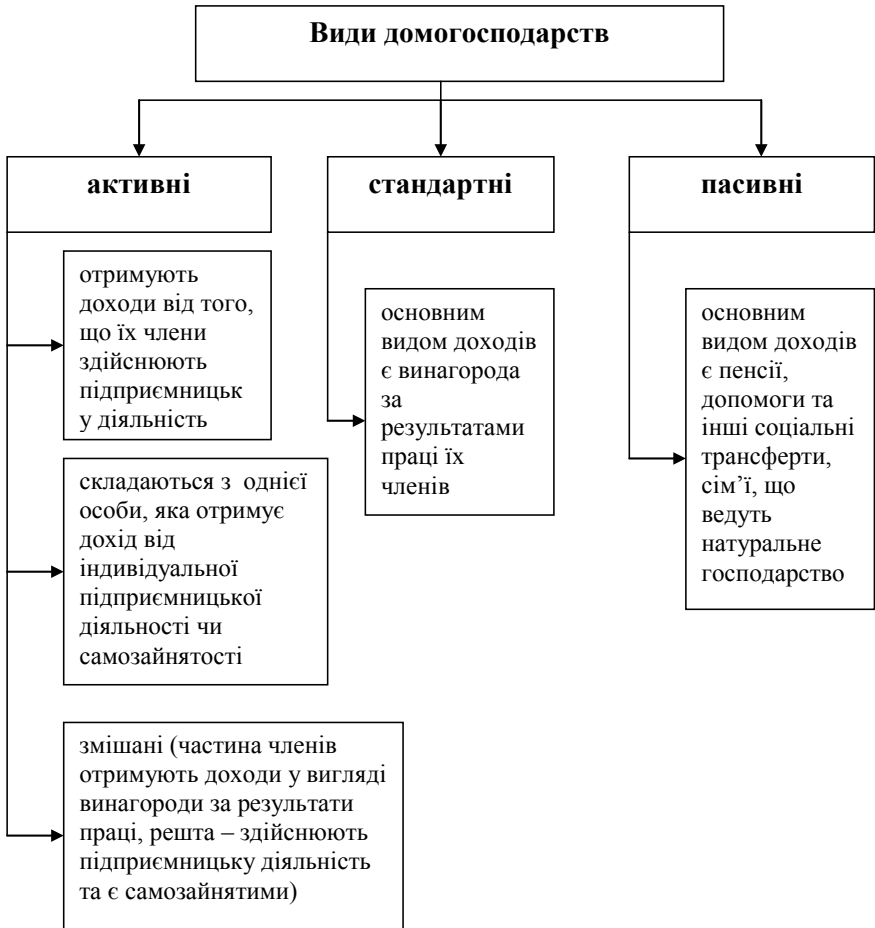
Рис. 2. Класифікація домогосподарств залежно від участі в економічному обміні*