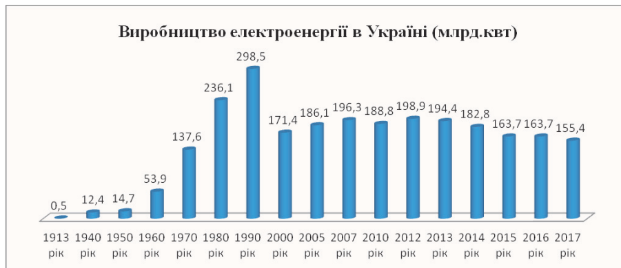
Рис. 2. Виробництво електроенергії в Україні (млрд квт) (розроблено автором за [6])

Серед таких джерел може бути електроенергія, виробництво якої в Україні стрімко диверсифікується. Але за наявності в Україні значної кількості гідроелектростанцій на малих ріках, виробництво електроенергії, як свідчать дані рис. 2, можна було б збільшити до рівня 1990 року.