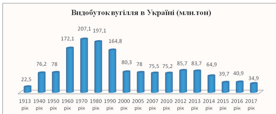
Рис. 3. Видобуток вугілля в Україні (млн тон) (розроблено автором за [6])

Так, у зв'язку із агресією Росії й утворенням невизнаних ЛНР і ДНР спостерігаємо падіння вуглевидобутку, в зоні бойових дій сформувався дефіцит марок вугілля, серед яких АТ і Т. Україна почала експортувати вугілля з Африканського й Американського континенту, а енергокомпанії змушені підписувати імпортні контракти.