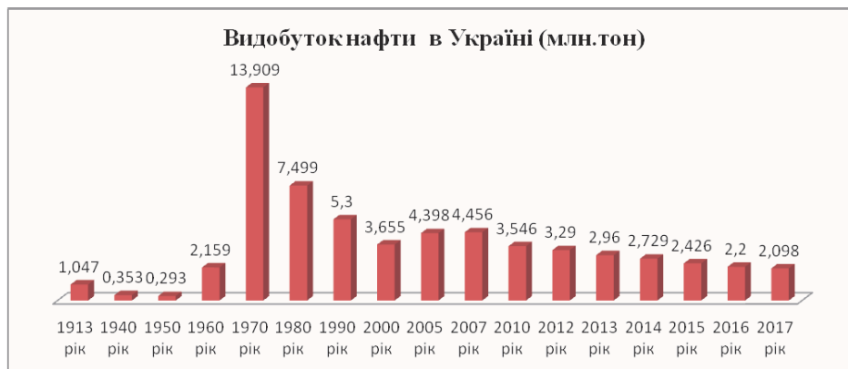
Рис. 4. Видобуток нафти в Україні (млн тон) (розроблено автором за [6])

Це особливий ресурс, який своєю ціною тисне на загальне ціноутворення на ринку України, це, насамперед, помітно на продовольчому ринку, коли ціни на пальне для аграріїв значно зросли, а значить працювати собі у збиток ніхто не буде.