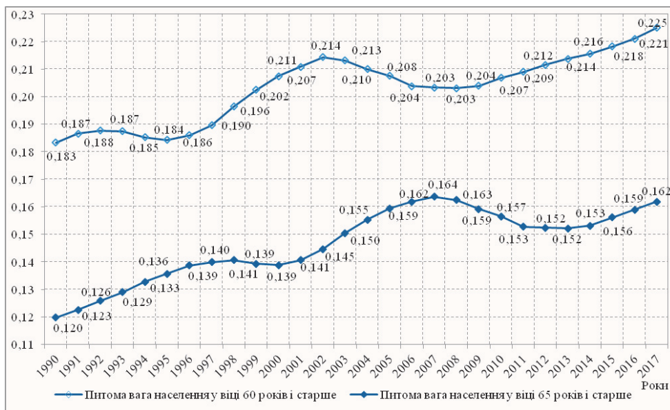
Рис. 1. Динаміка питомої ваги населення у віці 60 років і старше та 65 років і старше в загальному населенні України протягом 1990–2017 рр.

Виклад основного матеріалу. Починаючи з 1990 р. в Україні спостерігалася практично безперервна тенденція до зростання питомої ваги осіб у віці 60 років і вище в загальному населенні країни – з 18,3% у базовому році до 22,5% у 2017 р., рис. 1.