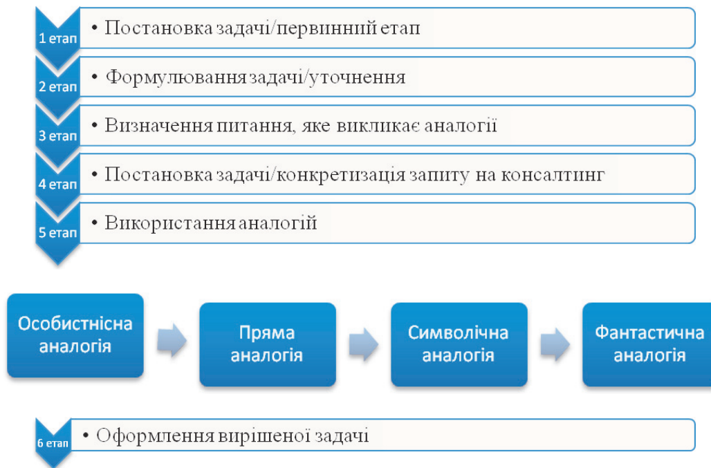
Рис. 2. Етапи реалізації процесу пошуку рішень за методом синектики

4. Пошук прямих аналогій: для цього кроку учасники повинні думати, виходячи за межі стандартів. Вони повинні залишити проблему і придумати прямі аналогії, які можуть бути застосовані до проблеми. Це збільшує творчість і дозволяє учасникам думати по-різному і всебічно поглянути на проблему. В кінці цього кроку вони повинні вибрати найкращу аналогію, яку знайшли.