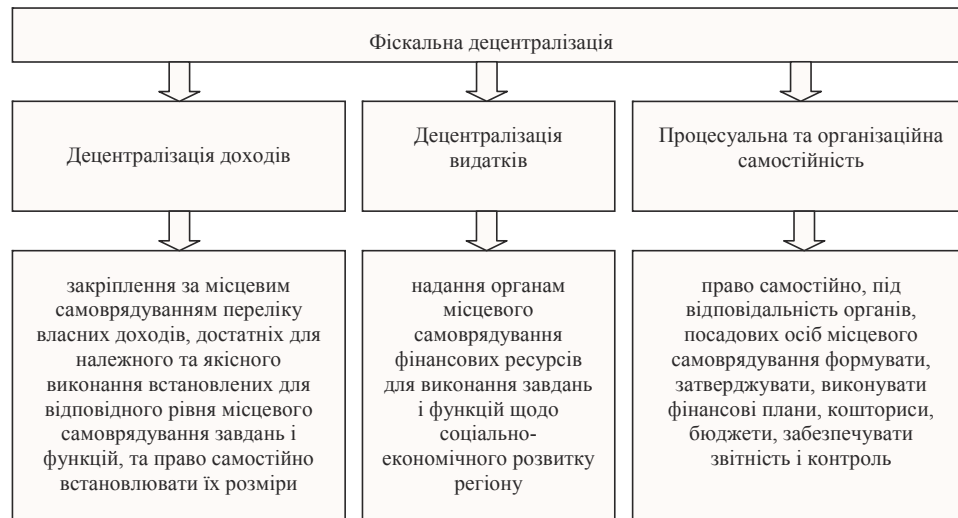
Рис. 1. Структура фіскальної децентралізації

Примітка. Складено автором за даними [4, с. 78].