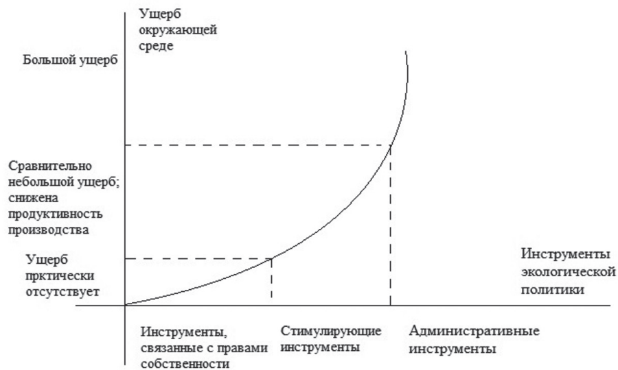
Рис. 2. Рациональное использование инструментов экологической политики

технологий, сырья и материалов. В то же время импорт природоёмкой и отходоёмкой продукции исключает ее производство в данной стране, уменьшая тем самым негативное производственное воздействие. Эти моменты необходимо учитывать при проведении внешнеэкономической и производственной политики в стране.