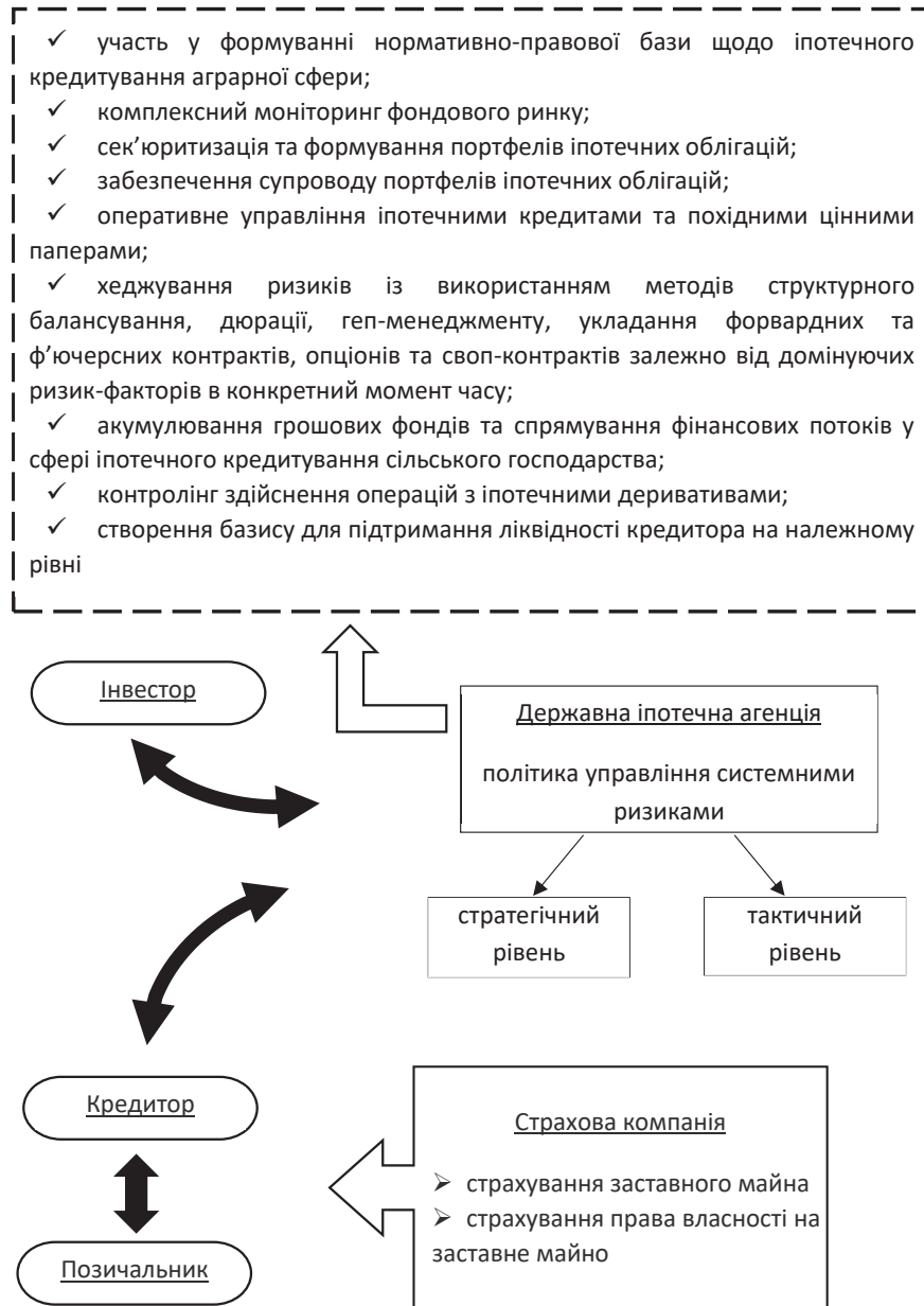
Рис. 3. Модель взаємодії інститутів управління ризиками в іпотечній системі

Під час формування та використання ресурсного потенціалу іпотечного кредитування у сфері інтересів інвестора існує ризик ліквідності іпотечних деривативів на вторинному фондовому ринку. Потреба у рефінансуванні кредитів спонукає кредитора виходити на ринок цінних паперів, забезпечених іпотечними кредитами. Емісія іпотечних облігацій пов'язана з виникненням ризиків, що у випадку емісії класичних облігацій лягають на кредитора, а в разі випуску облігацій з іпотечним покриттям ризик переходить до інвестора.