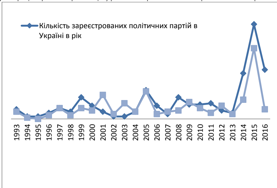
Рис. 1. Динаміка реєстрації політичних партій в Україні та Рівненській області 1

– 6; 2005 р. – 24; 2011 р. – 13 та 2014 р. – 38) (рис. 1) [2]. Одночасно, простежується кореляція між кількістю зареєстрованих політичних партій в Україні та кількістю зареєстрованих обласних партійних організацій політичних партій у Рівненській області. Тобто політичні партії як раціональні актори намагаються максимізувати вигоду від реєстрації партійних організацій у регіонах України з метою отримання певної ренти.