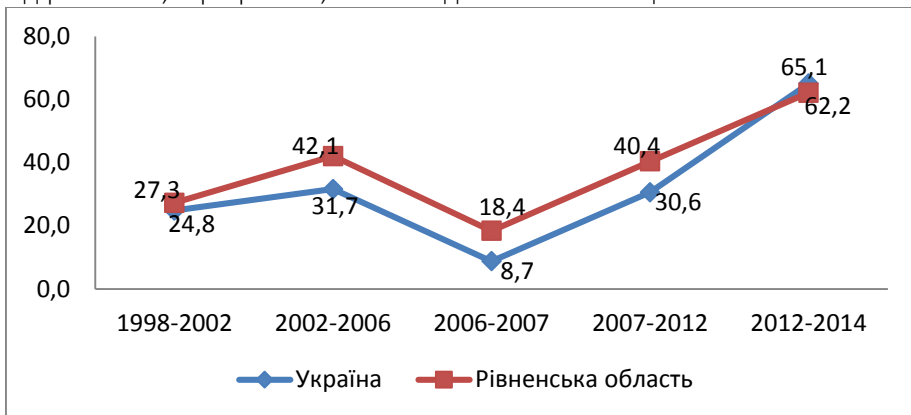
Рис. 3. Електоральна мінливість на всеукраїнському та регіональному рівнях (на прикладі Рівненської області)

низкою причин: поява нових політичних гравців – Народного Фронту та «Самопоміч», зростання підтримки Радикальної партії Олега Ляшка, суттєва втрата електоральної підтримки КПУ, Партії регіонів, ВО «Свобода» та ВО «Батьківщина».