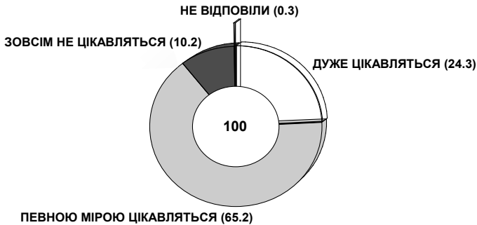
Діаграма 1. Розподіл відповідей респондентів на запитання: “Якою мірою Вас цікавить політика?”, у % до числа опитаних

Особливу увагу слід звернути на підвищення інтересу до політики у молоді м.Кіровограда. Перед цим варто наголосити, що з перших років незалежності частка молоді Україні, байдужої до політики, постійно зростала (наприклад, з 24% у 1995 р. до 34% у 2002 р.) 7 . Інтерес української молоді до політики стабільно “не дотягував” і до середнього рівня, хоча ця тенденція є типовою не лише для України, а спостерігається у більшості європейських країн (наприклад, у 1995 р. індекси інтересу молоді до політики у Британії та в Італії дорівнювали відповідно 2,16 і 2,52 бала, шкала п’ятибальна) 8 . Простежувалась ця тенденція і в сусідній Росії, де з 1989 року частка молоді, байдужої до політики, збільшилася у кілька разів 9 .