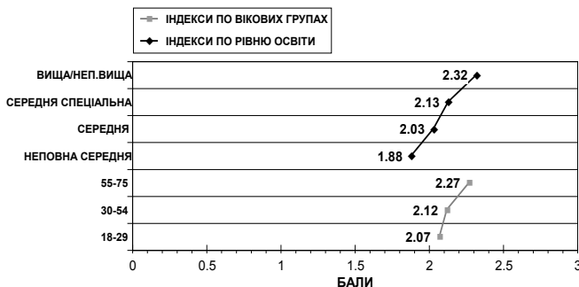
Діаграма 2. Індекси “постреволюційного” рівня інтересу до політики залежно від віку і освіти респондентів (індекси у балах, шкала: 1-3, середнє значення шкали – 2)

Отже, через чотири місяці після завершення масових акцій протесту – подій “помаранчевої революції”, для населення м. Кіровограда характерною була “постреволюційна інерційність” підвищеного інтересу до політики. Зафіксований рівень зацікавленості політикою не є типовим для політичної культури населення, яка, характеризувалась стабільно помірним інтересом до політики три-