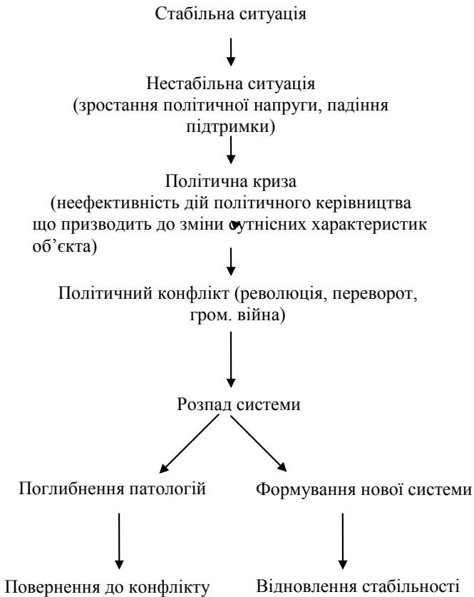
Рис. 1 Динаміка політичного циклу*

* Політичний цикл я визначаю як причинно зумовлений процес зміни політичних ситуацій, що визначають період, який триває від порушення до відновлення стабільності. Політичний цикл є частиною політичного процесу. Його особливість в тому, що він відображає нелінійний і непоступальний спосіб суспільних змін.