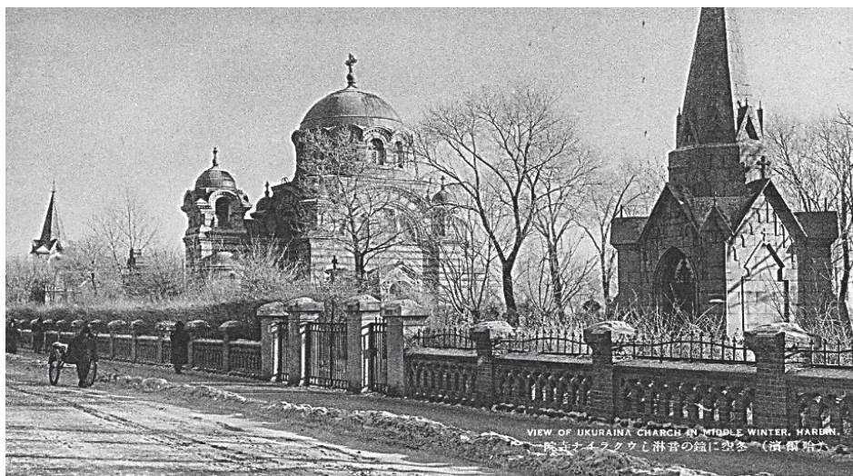
Фото 1. Самотня дзвіниця на фоні зимового неба. Український храм в Харбіні.

У вступній частині до «Огляду українських національних рухів» повідомлялось про те, що «до сьогодні проблеми України розглядалися лише в контексті Європи, проте є висока вірогідність того, що до вже існуючих проблем можуть додатись і ті, що визрівають серед українців на Далекому Сході», і «якщо ті ідеї, які поширюються серед українців в Маньчжурії та на Далекому Сході координуються і узгоджені з тими рухами, що розгортаються в європейській частині України, то ситуація, що зараз спостерігається на Далекому Сході з огляду на те, що проблема національних питань набула нового змісту, мабуть, свідчить про те, що ми зіткнулись з переломною епохою» [6, с. 39]. Таким чином, на сторінках видання відображалось занепокоєння тогочасними подіями. Також у тексті «Передмови» вказувалось, що в Маньчжурії проживало 15000 українців. Проблеми, що стосувались українського національного питання були актуальними не лише в Європі, але й на Далекому Сході і стали рушієм українського національного руху. З вищенаведених фактів зрозуміло, що в «Огляді українських національних рухів» подавалася достовірна інформація про Україну та її діаспору, а також об'єктивна оцінка ситуації, в якій опинилась українська громада в Маньчжурії.