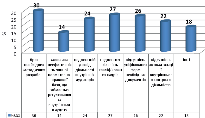
Рис. 1. Результати опитування щодо найбільш проблемних аспектів внутрішнього аудиту, %