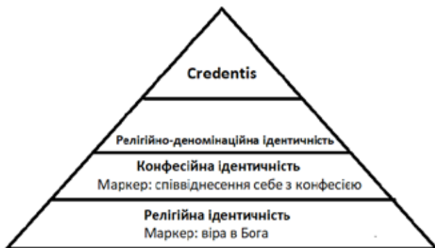
Малюнок 1. Багаторівневість (поетапність) релігійної ідентичності 44

Аналогічну градацію використовує І. Клімук, пояснюючи її наявність самою сутністю «релігійної ідентичності» – багаторівневістю (див. малюнок 1). Така структура, на думку дослідниці, формується в результаті пошуків себе у вірі 43 .