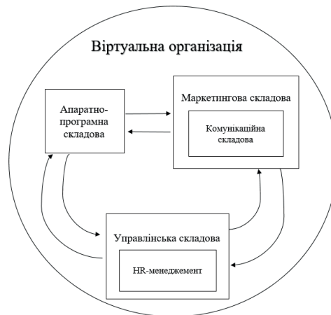
Рис. 1. Структурно-логічна схема взаємозв'язків між елементами віртуальної організації