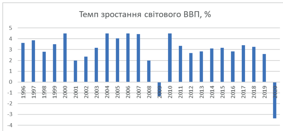
Рис. 1. Темп зростання світового ВВП (1996-2020), % [5]

Міжнародний валютний фонд (МВФ) назвав економічну кризу, спричинену COVID-19, «Великим локдауном» (англ. Great Lockdown ). Порівнюючи річний темп зростання світового ВВП (рис.1), економічне зростання у 2020 році сповільнилось на 5,97% у річному вимірі, що робить «Великий локдаун» найгіршою рецесією з часів Великої Депресії, і набагато гіршою ніж Глобальна фінансова криза, за якої зростання сповільнилось лише на 3,3%.