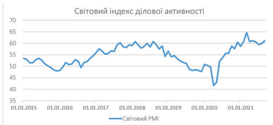
Рис. 2. Світовий PMI (2015-2021 рр.) [10]

У 2020 році валове нагромадження основного капіталу (GFCF) скоротилося на 24,4% [9].