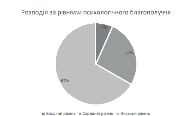
Рис. 1 Рівні психологічного благополуччя студентів станом на грудень 2022 року

під час воєнного стану. У праці Н.Коструби та З. Поліщук результати проведеного дослідження показали, що 26.67% із 30 опитаних студентів мали низький рівень психологічного благополуччя, 66.67% мали середній рівень, а високий рівень спостерігали лише у 6,67% студентів (рис.1). Хоча дуже мала кількість студентів має високий рівень психологічного благополуччя, усе ж у більшості ми спостерігаємо середні показники, що вказує на те, що загалом студенти не почувають себе пригнічено, мають цілі в житті та хороші стосунки з іншими, попри воєнний стан у країні. Оскільки дослідження проведено наприкінці 2022 року, а саме у грудні, такі результати можуть свідчити про пристосування студентів до ситуації в країні [1].