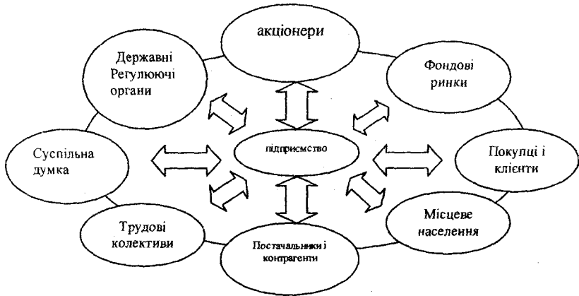
Рис.2. Схема взаємозв'язку підприємства з зовнішнім світом

компаній, що в кінцевому результаті призведе до високих фінансових результатів діяльності, які, у свою чергу дадуть змогу забезпечити на належному рівні достаток власників капіталу через виплачені дивіденди.