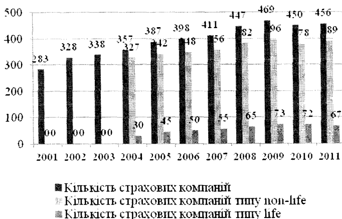
Рис. 3. Динаміка кількості страхових компаній в Україні за 2001 – 2011 рр. (на початок року)

Згідно новоприйнятих змін, стають жорсткішими умови створення та функціонування страхових компаній, мінімальні розміри статутних капіталів яких мають становити як мінімум 1 млн. євро для компаній, що займаються ризиковим страхуванням (non-life) та 1,5 млн. євро для компаній зі страхування життя (life). Змінами до Закону України “Про страхування” також визначено, що страхування життя передбачає обов’язок страховика здійснити страхову виплату відповідно до договору страхування у разі смерті застрахованого. Умови страхування життя можуть передбачати й обов’язок страховика здійснити страхову виплату в разі нещасного випадку із застрахованою особою і/або її хворобою [1].